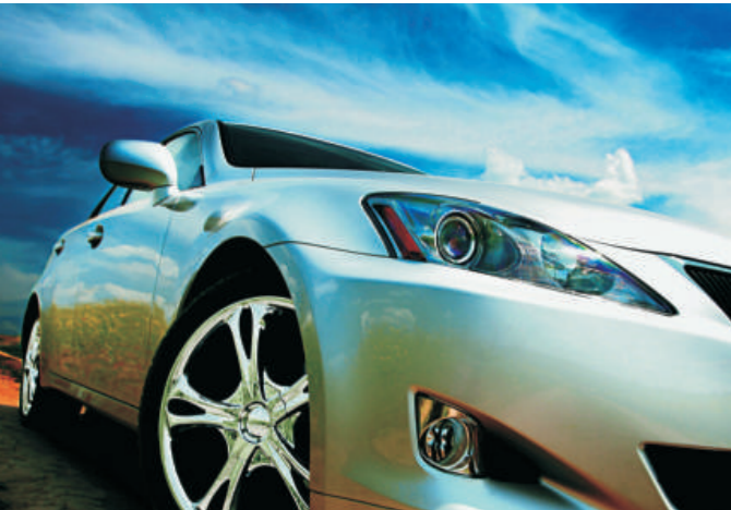
Die Automobilindustrie setzt hohe Standards an Leistung, Qualität und Design. Die hochwertige STI-Beschichtung trägt massgeblich zu einer verbesserten Formgebung der Fahrzeuge bei.

Viele renommierte Automarken verdanken ihre attraktive Formgebung auch der STI Oberflächentechnologie. Das Hartchrom Teikuro Verfahren gehört zu den weltweit anerkanntesten und besten Beschichtungsverfahren für Formwerkzeuge der Automobilindustrie.